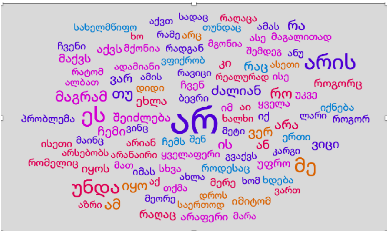
დიაგრამა 3. სოციალურად დაუცველ ჯგუფთა ინტერვიუებში სიტყვათა სიხშირული ანალიზი

მათთან ჩანერილი ინტერვიუების ტექსტური ანალიზი აჩვენებს, რომ სოციალურად დაუცველი ჯგუფებისთვის უარყოფისა და გამოთიშვის თემა აქტუალურია, რადგან მათი ნუხილების შესწავლით ხუთი მონინავე სიტყვა გამოიკვეთა: არ, არის, უნდა, მე, ეს (იხ. დიაგრამა 3). ამასთანავე, მათი აღქმების ანალიზი მიუთითებს სოციალურად დაუცველი ჯგუფების მდგომარეობის ცვლილების საჭიროებაზე.