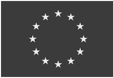
დაფინანსებულია ევროკავშირის მიერ

ანგარიშის შინაარსზე პასუხისმგებელია ავტორი და მასში გამოთქმული მოსაზრებები არ ემთხვევა ევროკავშირის პოზიციას.